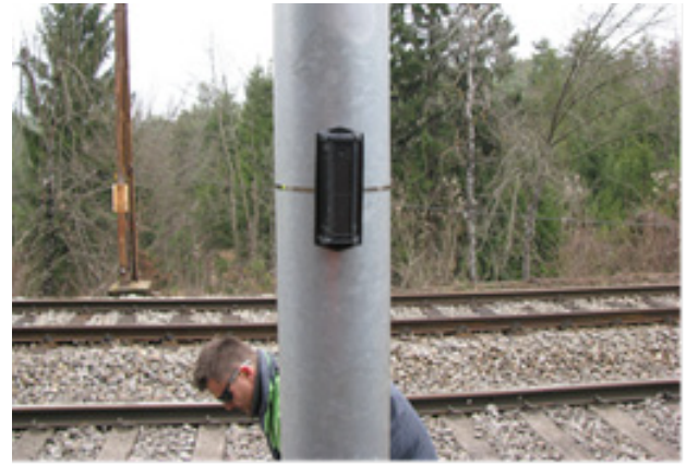
Fig. 2: Installation of acoustic deterrents on electrical poles

Večje hitrosti so nedvomno povezane z večjimi tveganji za trke z živalmi na železnicah. Zmanjšanje hi-