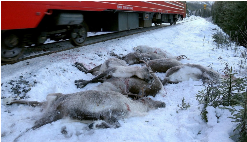
Slika 1: Povoženi severni jeleni ob železniški progi na Norveškem, november 2017