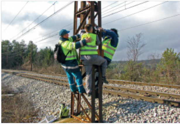
Slika 2: Nameščanje zvočnih odvrtač na električne stebre

povečala delež živali, ki jim je uspelo, da so se umaknile z železniških prog (84 % proti 68 %); v povprečju so se umaknile za okoli 20 s hitreje. Sklepali so, da se živali na oddani zvok niso navadile (habitacija), saj je delež srnjadi, ki je reagiral na zvok odvrtač, ostal enak prvo in drugo leto raziskave (Babinska-Werka in sod., 2015).