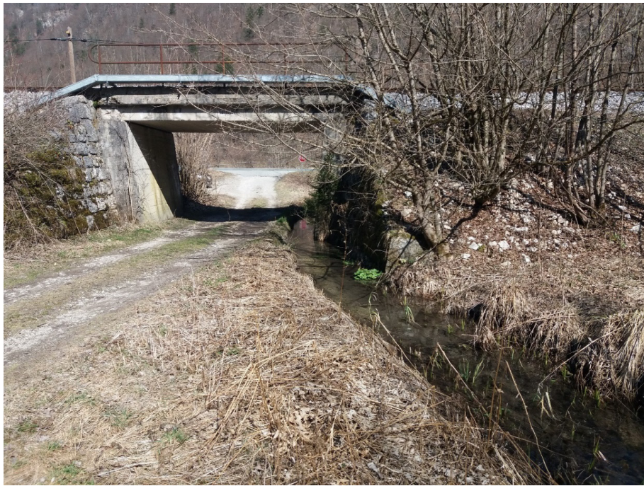
Slika 4: Večnamenski podhod pod železniško progo Bled-Bohinjska Bistrica v bližini kraja Nomenj