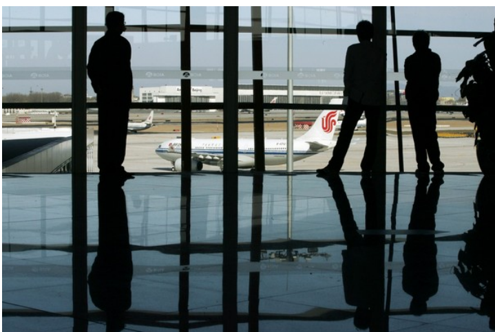
Slika 2: Letališče

Vir: Avtor, leto (navedemo, če uporabljamo lastne slike in želimo poudariti avtorstvo.)