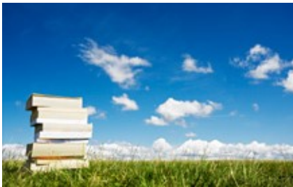
Slika 1: Primer postavitve fotografije

Če avtor ni znan, navedemo naslov, letnico in številko strani. Če gre za spletni vir, napišemo priimek avtorja in letnico (Novak, 2011) V poglavju Viri in literatura izpišemo celoten bibliografski opis. Za naslovi in viri ne pišemo pike.