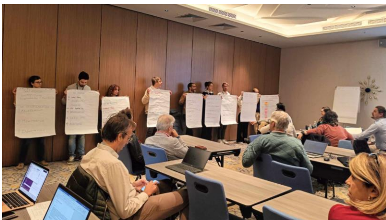
Delavnica »ThinkTank Match-making«

Srečanje smo zaključili s hibridnim sestankom, ki je služil za informiranje vseh zainteresiranih, ki se sestanka v Sofiji niso mogli osebno udeležiti. Vodja vsake ThinkTank skupine je predstavil dogajanje preteklih dveh dni znotraj skupine, ključne ugotovitve in naslednje korake. Vsi smo se strinjali, da smo naredili pomemben napredek pri doseganju končnega cilja, sedaj pa sledi integracija vseh novih znanj in mnenj.