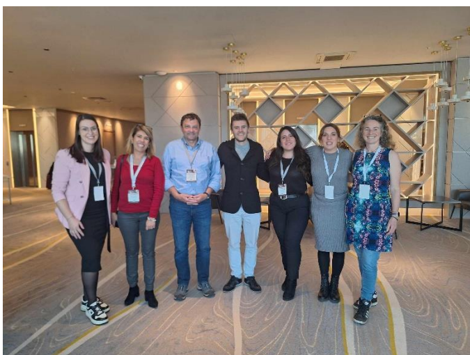
Člani ThinkTank Soil Literacy skupine

Srečanje je služilo kot odlična priložnost za izmenjavo in nadgradnjo znanj posameznika, medsebojno spoznavanje različnih strokovnjakov, ustvarjanje povezav in poznanstev, ki bodo morda snovala nove ideje o raznih aktivnostih in projektih.