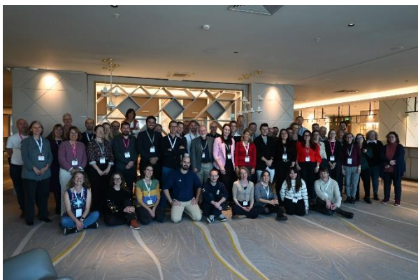
Skupinska fotografija vseh udeležencev SOLO konference v Sofiji