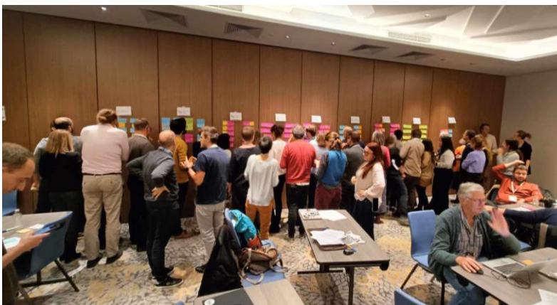
Delavnica za medsebojno izmenjavo izkušenj in mnenj

Drugi dan srečanja smo pričeli s premislekom o vrzelih v znanju, katerih do sedaj še nismo omenili. Pogovorili smo se o vzroku – ker niso pomembne ali ker so bile pozabljene? Diskusiji je sledila delavnica, imenovana »ThinkTank match-making«, v kateri smo sodelovali vsi udeleženci. Vsaka ThinkTank skupina je izpostavila svojo tematiko, v kateri so najbolj izkušeni ter področje, kjer potrebujejo zunanje mnenje in pomoč. Na ta način smo našli najbolj ustrezne pare skupin in lahko smo si medsebojno izmenjali svoje znanje in nove ideje. Na ta način smo znotraj skupine pridobili dodatno perspektivo na problematiko tal. Razdeljeni po skupinah smo debatirali tudi o najnujnejših ukrepih, ki jih potrebujemo za izboljšanje področja posamezne ThinkTank skupine ter motivirajočih dejavnikov za posameznike, ki rokujejo s tlemi tako ali drugače. Sledila je še identifikacija in prioritizacija ozkih grl, za katere menimo, da najbolj omejujejo izboljšanje splošne pismenosti o tleh. Sledila je še ena delavnica za vse udeležence, imenovana »World-café«, kjer smo se skupine ponovno premešale in tako smo lahko s svojimi izkušnjami in znanjem pomagali še drugim skupinam.