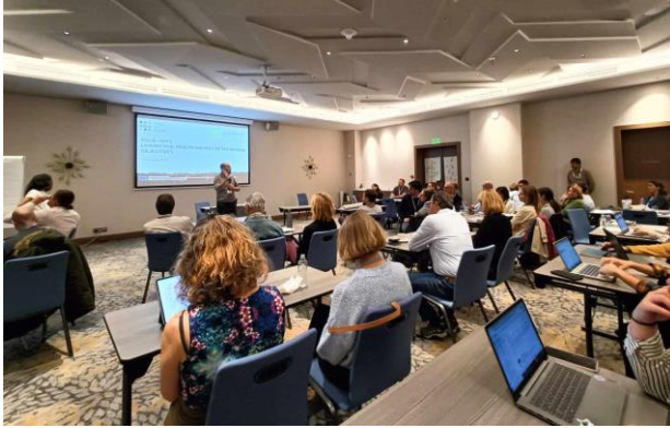
Uvodno predavanje za vse udeležence konference

Prvi dan konference smo otvorili s skupnim srečanjem vseh udeležencev, v okviru katerega smo se seznanili z dosedanjim opravljenim delom ter uporabljeno terminologijo, kot so izrazi »vrzeli v znanju«, »motivacijski dejavnik« in »ozko grlo«. Sledilo je delo po skupinah, v okviru katerega smo skozi razne aktivnosti, delitvi izkušenj, znanj in mnenj, diskutirali o pomembnih vrzelih v znanju o tleh. Pripravili smo tudi vizualizacijski koncept za prikaz miselnega procesa, ki ga bomo vključili v posodobljeno verzijo končnih dokumentov. Dan pa smo zaključili s procesom prioritizacije vrzeli v znanju in na ta način določili tiste, za katere menimo, da potrebujejo največ pozornosti.